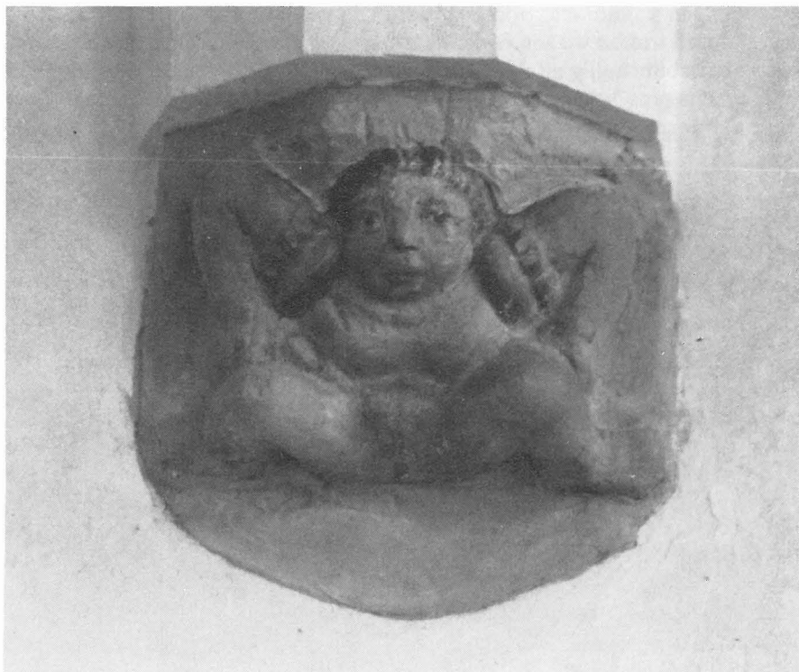
Het kraagsteenbeeldje op de vierde zuil gerekend vanuit het oosten.

In het februari-nummer van Oud-Zutphen (Jg. 5, no. 1) gaf de heer Buijs een interessante overdenking over een opmerkelijk beeldje in de Librije van de St. Walburgskerk. De betreffende voorstelling werd wat mysterieus omschreven, een afbeelding ervan is daarom op zijn plaats. Als we burlesk opvatten als boertig en plat, mag de voorstelling zeker in die categorie worden ondergebracht. Zij gaat in dit opzicht verder dan de andere voorstellingen met een grappig karakter. Alvorens wij ons afvragen of het hier inderdaad, zoals de heer Buijs stelt, om een verbeelding van sexuele verleiding of een vruchtbaarheidssymbool gaat, willen wij enige opmerkingen vooraf maken om het beeldje in zijn omgeving te plaatsen.