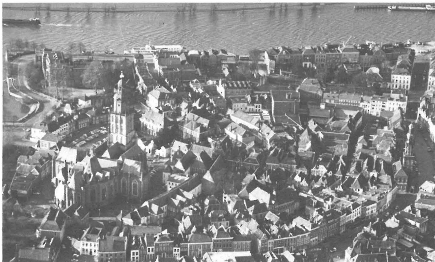
De oude grafelijke kern van Zutphen met de imposante St. Walburgskerk rond 1975.

De proost trad al in de oudste oorkonden als getuige op. 9 Leden van het kapittel, inclusief de proost, traden op als hoogste ambtenaren van de graaf: ze werden tolheer aan de IJssel, kanselier van Gelre, of inquisiteur namens de hertog. In Deventer vulden de kanunniken zelf bij toerbeurt hun eigen college aan en ze kozen hun proost.