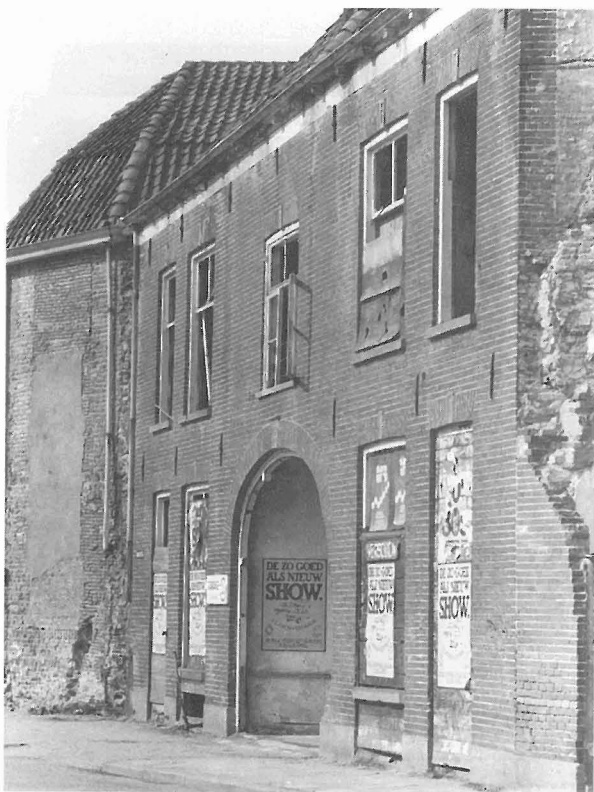
In een nummer met oude artikelen mag zoiets natuurlijk niet ontbreken: de zo goed als nieuw show. De panden stonden aan de Komsteeg.

Wobbe Hannemans exploiteerde blijkbaar een heilig huisje oftewel taveerne, die wel kort bij de kerk, in de Lange Hofstraat gestaan zal hebben. Was het "De stad Utrecht" of "De Roode Toren"? Wij hopen het nog eens te vinden. Dat dáár voor, onder, en na het gieten een stevig kannetje wijn gebruikt is, blijkt duidelijk: 14 schilden, de waarde van ongeveer zeven vette varkens. Maar dat hoorde zo: een afspraak of contract dat niet behoorlijk begoten was – de wijnkoop werd dat genoemd – deugde eigenlijk niet en brave Zutphenaren hebben in vroeger tijd hun Zutphens volkslied altijd hoog gehouden: Alles wat uut Zutphen kump , enz.