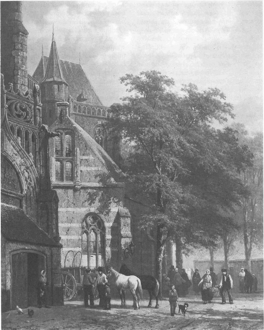
In de 19de eeuw zag C. Springer de Sint Walburgiskerk zo! Hier is heel veel veranderd! Het origineel is in het Stedelijk Museum Amsterdam.