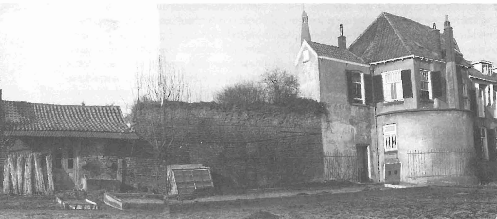
De flat (schoenendoos) die hier na de Tweede Wereldoorlog is gebouwd, heeft alweer plaats gemaakt voor