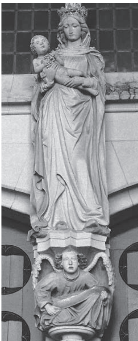
Het beeld van Maria (met kind, boven een engel), zoals dat er nu staat in het Mariaportaal.

toegepast zijn de uitbeelding van het Laatste Oordeel, de Christusfiguur met twaalf apostelen, die als zijn rechtshelpers worden beschouwd, en de Salomofiguur, als wijze rechter bij uitstek. Soms is sprake van een combinatie van deze afbeeldingen. Bij een Laatste Oordeeltafeel is het verband tussen de oordelende Christusfiguur en de aardse