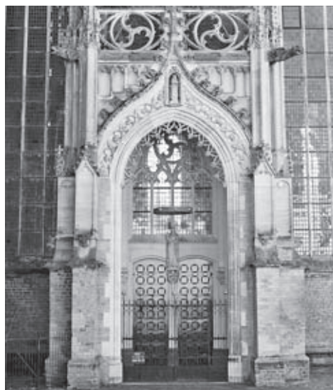
Het Mariaportaal in 2009, ‘middeleeuwer’ dan vóór de restauratie van 1889.