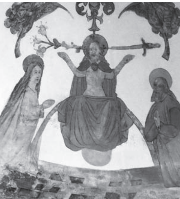
Plafondschildering van het Laatste Oordeel in de Sint-Walburgiskerk.

De in een kerkportaal aanwezige iconografie kan verwijzen naar rechtspraak. Veelvuldig