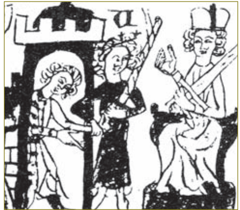
Iemand wordt vanuit een kasteel voor de (zittende) rechter gesleept. (afbeelding uit de Saksenspiegel)

Er zijn in het Mariaportaal aanwijzingen op grond waarvan de vraag kan worden gesteld of het zo’n gerechtspitaal geweest is.