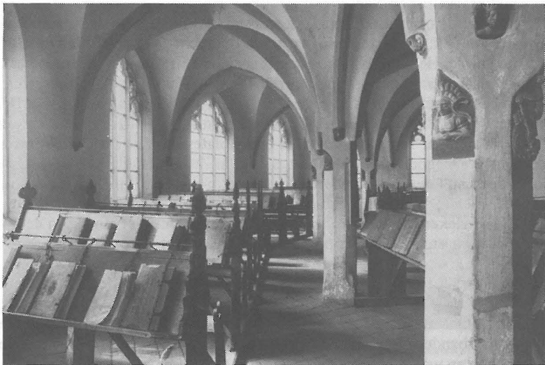
De librije in de St. Walburgkerk

De tentoonstelling wordt begeleid door een geïllustreerde catalogus, waarin naast het catalogusgedeelte 13 artikelen over verschillende aspecten van de Zutphense boeken opgenomen zijn.