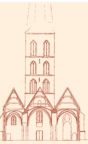
Afb 7 Dwarsdoorsnede van een hallenkerk (de Nieuwstadskerk, naar Ter Kuile).

hallenkerk, omdat de beide schepen ongeveer even hoog zijn.