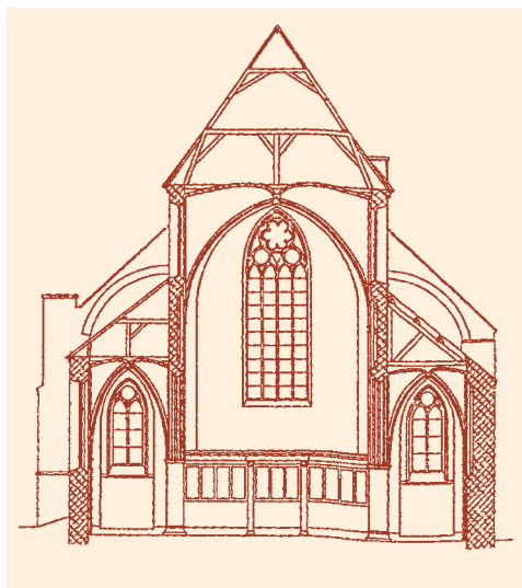
Afb. 2 Dwarsdoorsnede van een basilicale kerk (de voormalige Broederenkerk, naar Ter Kuile).

De kerken die na de Reformatie nieuw werden gebouwd, bestaan gewoonlijk ook uit één