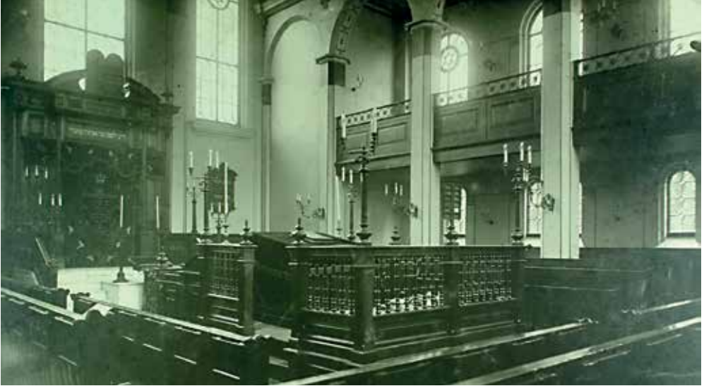
Afb. 8 De (vooroorlogse) synagoge aan de Dieserstraat.

oorlog is in de sjoel namelijk een betonnen tussenvloer aangebracht, waardoor ook de hoogte van het middenschip is gehalveerd. Het schip wordt gedekt door één zadeldak.