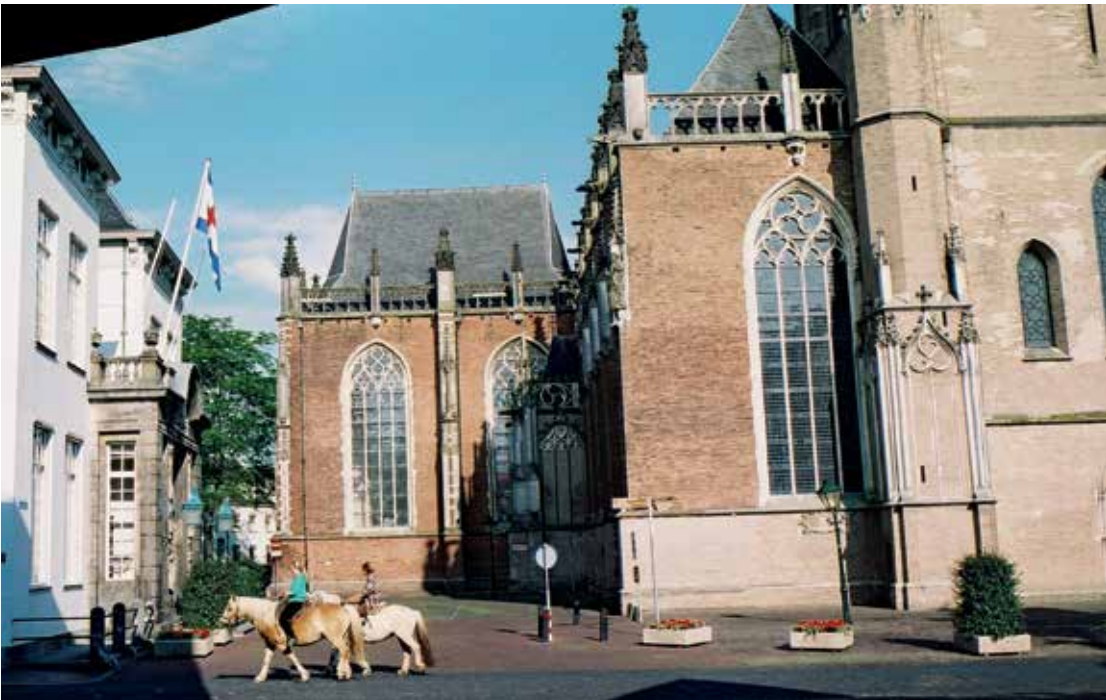
Afb. 4 De Walburgiskerk.

Verondersteld wordt dat ook de twee kerken die aan de huidige Grote of Walburgiskerk voorafgingen (afb. 4): de vroegromaanse Petruskerk uit circa 1046 en de romanogotische Walburgiskerk uit de eerste helft van de 13de eeuw, basilicaal zijn geweest. De 'oude' Walburgiskerk, waarvan we het middenschip nog steeds kennen, had stenen gewelven, dit in tegenstelling tot de Petruskerk. De middenbeuk van de romanogotische kerk is bewaard gebleven en is opgenomen in de bestaande,