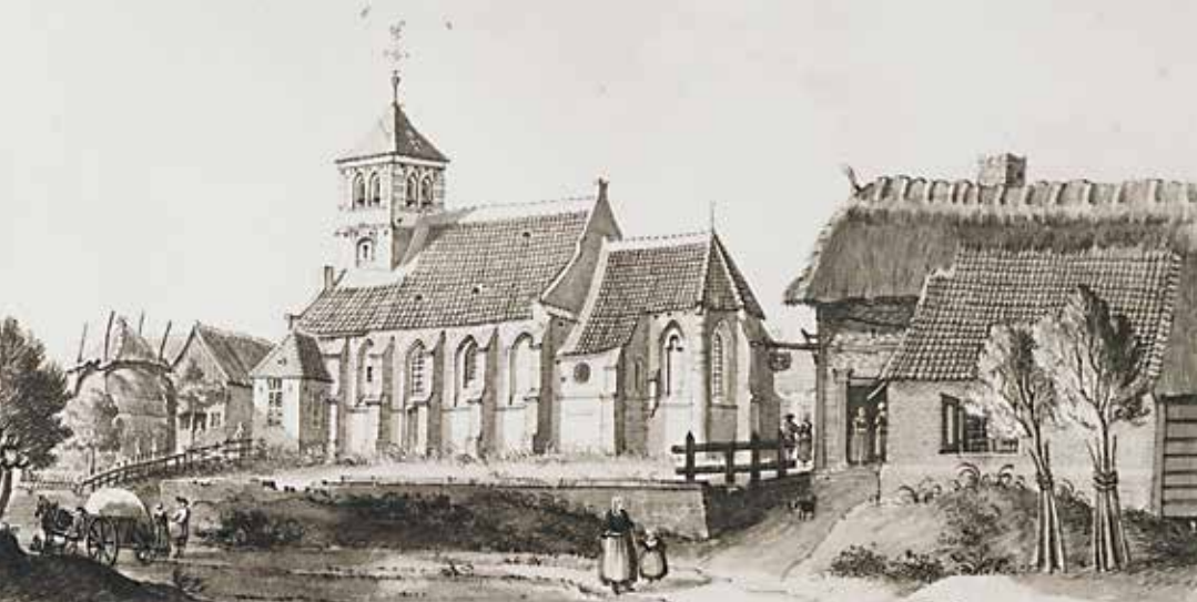
Afb. 6 Gezicht op de Martinuskerk in Warnsveld in 1743 door Jan de Beijer. (Regionaal Archief Zutphen)