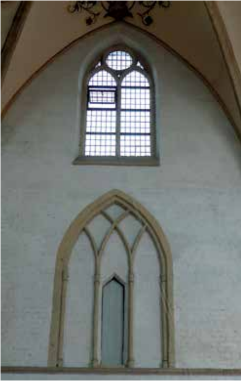
Afb.3 Gekruiste gaffels.

hebben ieder een breedte van circa 4,85 m.