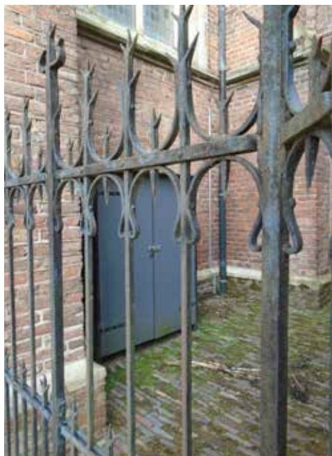
Aan de buitenkant zit nu een kast.

Na de Reformatie werd het interieur van de kerk veranderd. Altaren en beelden werden verwijderd, het hoogkoor werd weggebroken, het sacramentshuis verdween. Men geloofde niet langer dat Christus lijfelijk aanwezig was in de gewijde hostie .