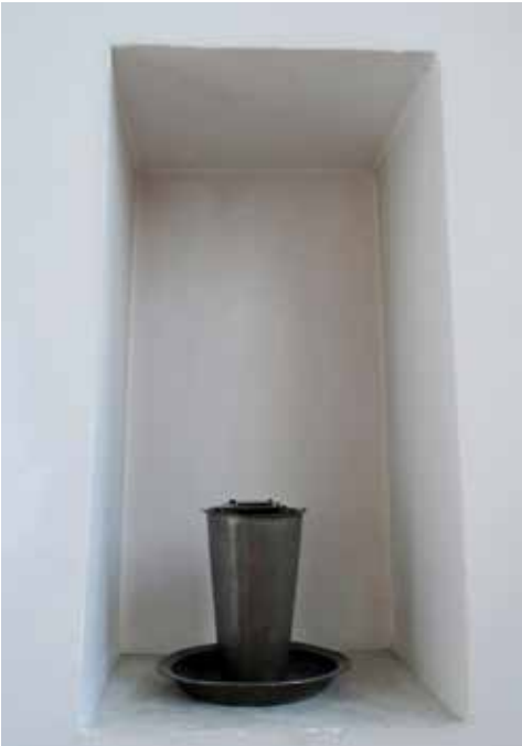
Nis, voormalig sacramentshuis in St. Marinuskerk, Warnsveld.

Over het tralievenster werd niet meer gesproken. Wel had men het over een klein deurtje, op de grafkaart van 1681 ‘Doodt Graevers Deurken’ genoemd. De contour daarvan is na 1995 weer te zien, in dezelfde spaarnis als het venster. Het lijkt een bedieningsdeurtje geweest te zijn in de verder dichte zuidmuur. Eerst bij de restauratie van Cuypers, rond 1900, werd in de zuidmuur een dubbele deur aangebracht, die tegenwoordig als bedieningsdeur fungeert. Wat er aan de buitenkant van het venster en het deurtje in de loop van de tijd veranderde, is onduidelijk.