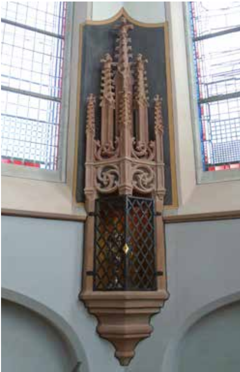
Sacramentshuis St. Jan.

In 1995 heeft men het raampje gefotografeerd en opnieuw weggewerkt. Het sacramentshuis waar het op uitkeek, heeft men respectvol hersteld op basis van oude tekeningen. Het heeft weer à jour deurtjes gekregen, waardoorheen men een monstrans met de gewijde hostie kan zien staan.