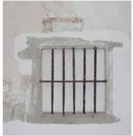
Links: het tralievenster met omgeving. Rechts: venster met verfsporen

Het raampje is vierkant, 65 bij 65 cm. Het heeft vijf verticale tralies en één horizontale stang. Bij de aanzet van de tralies en rond het venster zijn nog verfsporen van een verflaag uit het midden van de vijftiende eeuw. 1 Dat duidt erop, dat het venster direct aangebracht is bij de bouw van de nieuwe buitenmuur van de zuiderzijbeuk na de torenbrand