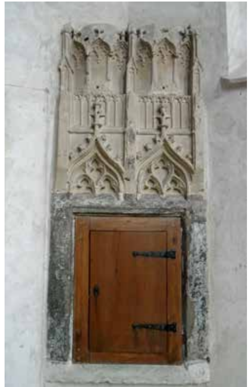
Dorpskerk Zelhem, restant sacramentshuis.

Waar het sacramentshuis van de Walburgiskerk gestaan heeft, is niet bekend. In kleinere kerken bevindt het zich altijd in het koor tegen de noordwand aan de voet van het bordes