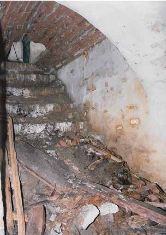
Een van de andere kelders waar twee ijzeren staven, rustende op ijzeren duimen in de muur, zijn aangebracht. Op die staven stonden een paar kisten die hier bijna vergaan zijn.

De koperen plaat lag los op de kist omdat de ijzeren spijkertjes waren weggeroest. Die plaat heb ik meegenomen, schoongemaakt en de groeven heb ik ingewreven met talkpoeder. Zodoende kon de tekst op de plaat goed worden gefotografeerd. Daarna werd de