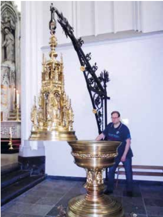
Geopend vont te Overveen.

per voorstelt. Helaas mist hier Christus.