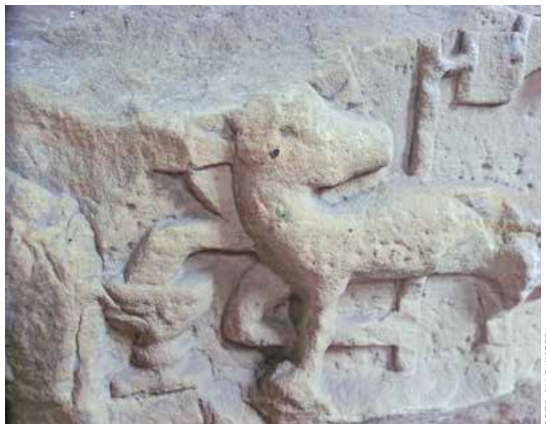
Vont te Buitenpost.

Deze symboliek werd in die tijd veelvuldig toegepast bij vonten. In een groot gebied, vanaf Antwerpen tot aan de Harz, kan men nog verwante vonten vinden. Ook in de Mariakerk (De Alde Witte) in Buitenpost (Friesland) heeft men nog een stenen doopvont uit de tweede helft van de 15 e eeuw in de vorm van een bokaal, waarop