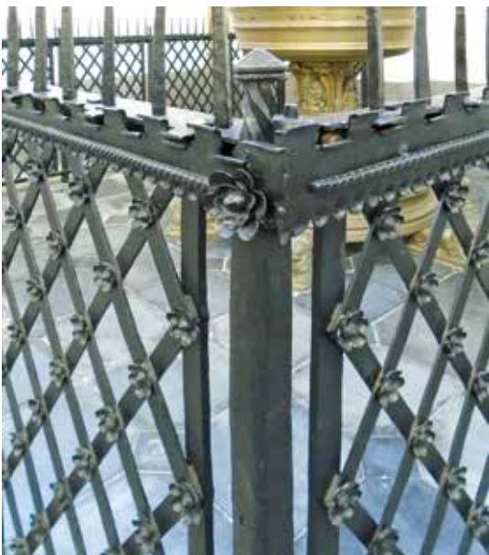
Hek van de dooptuin.