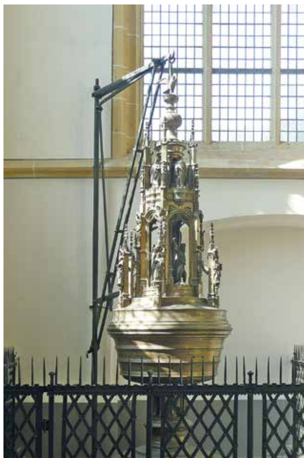
De doopvont in haar huidige staat.

Het belangrijkste sierelement van het deksel is het dooppaviljoen. Het lijkt wat op een hoge zonnetent waarin nog twee van de drie figuren staan. Standaard bestaat deze figurengroep uit: vooraan Christus, die zijn bovenkleed afgegeven heeft om zelf gedoopt te worden, met schuin achter hem een engelfiguur die dat kleed over zijn armen draagt en een derde figuur, die altijd Johannes de Do-